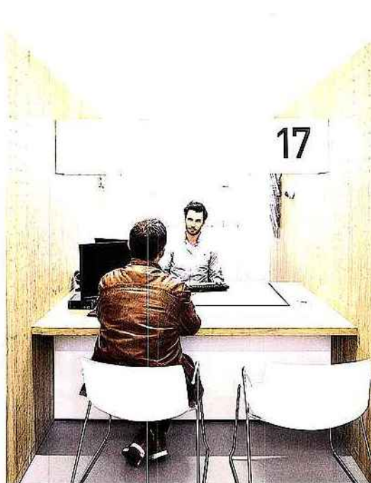
Halboffene, offene und geschlossene Servicebereiche berücksichtigen unterschiedliche Stufen ...