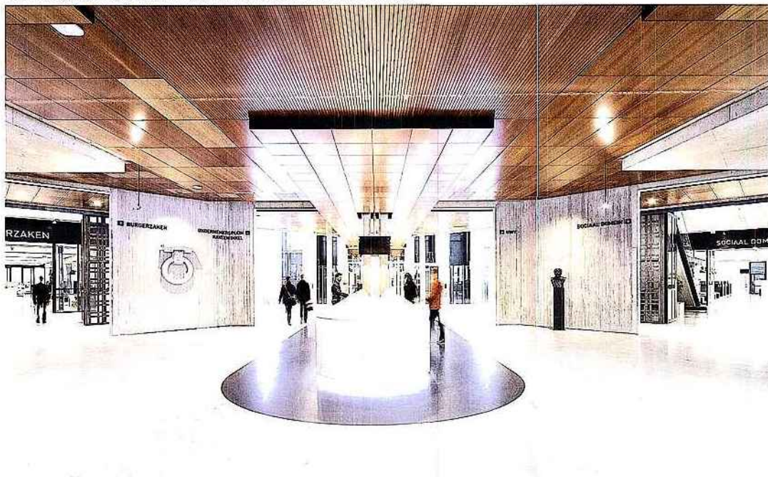
Im Zentrum der großzügigen Eingangshalle steht den Bürgern eine lange, weiße Self-Service-Rezeption zur Verfügung. -