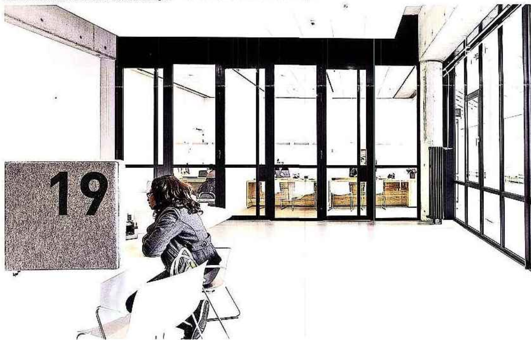
... an Privatsheit, Diskretion und Sicherheit in beiden Gebäudflügeln.