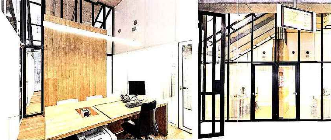
Nachhaltige Materialien sollen sicherstellen, dass die öffentlichen Gelder gut investiert sind. • Nachhaltige Materialien sind ein wichtiger Teil der Lösung, um die Energieeffizienz zu verbessern.