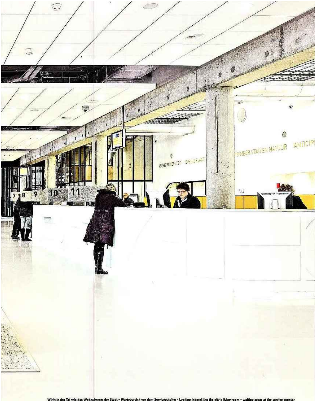
Wirkt in der Tat wie das Wohnzimmer der Stadt - Wartebereich vor dem Serviceschalter - Looking indeed like the city's living room - waiting areas at the service counter