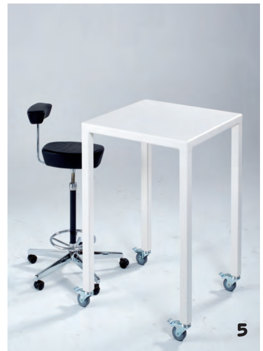
1, 2 en 4. De PRO table is een ontwerp van atelier PRO architecten en werd oorspronkelijk bedacht voor het Stadhuiskwartier in Deventer. De naam van de bedenker staat duidelijk in het frame van de tafel. Het is volgens Wim van der Plas een zuivere sculptuur zonder toeters en bellen en afgewerkt met een aanbare zachte lak. 3. De vormgeving van de meubellijn Elementary is geïnspireerd op het figuur uit Pac-Man, ontwerp NOAHH. 5. De MONO Move is voorzien van zwenkwielen. 6. Deze ranke tafel – de MONO Standaard – is een ontwerp van Anouk Dekker van OIII Architecten en meet 4 meter. De stalen buizen zijn verstevigd met polyester en het meubel oogt als een monoliet.