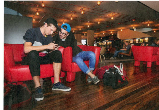
Het interieur van OBA Oosterdok is flink vernieuwd en daarmee toegankelijker geworden.